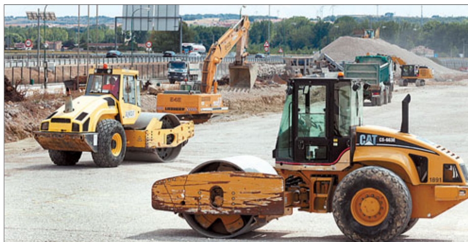
Las máquinas trabajan en terminar de nivelar la plataforma.