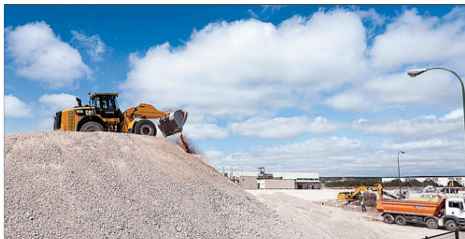
El escombros de la vieja fábrica se ha transformado en hormigón para ser reutilizado. / PATRICIA